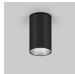
SASSO 100 round ceiling