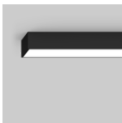
MINO 100 surface