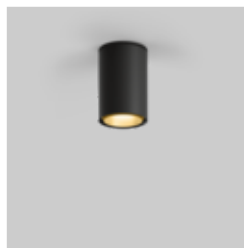
SASSO 60 round ceiling