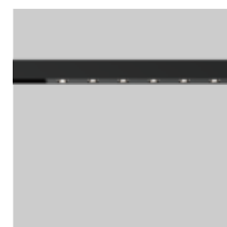
SPOT LINE MOVE IT 25