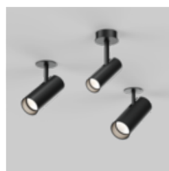
BO semi-recessed / surface