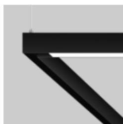
MOVE IT 25 surface / suspended system