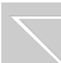
FRAME 60 trim system