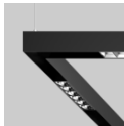
MOVE IT 45 surface / suspended system