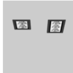
UNICO L2 / L3 basic recessed