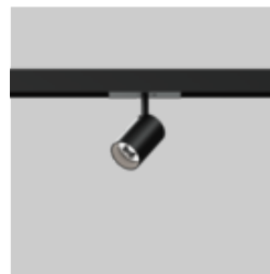
JUST 45 MOVE IT 25 / 25 S / 45