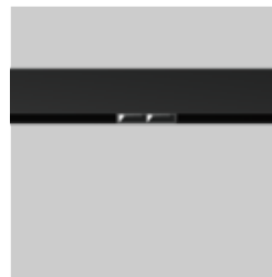
L2 MOVE IT 45