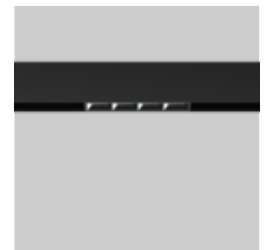
L4 MOVE IT 45