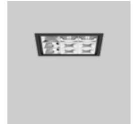
UNICO Q9 basic recessed