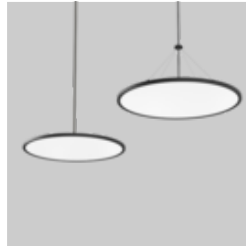
TASK round suspended