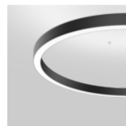
MINO 60 CIRCLE suspended