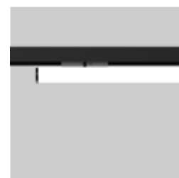
PIVOT MOVE IT 25 / 45