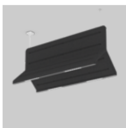
MUSE DOUBLE LIGHT acoustic suspended