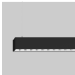
BASO 40 suspended