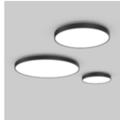
VELA surface / ceiling