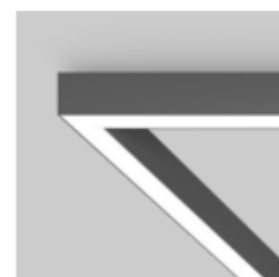
BASO 60 IP54 surface system