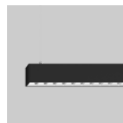
BASO 40 suspended