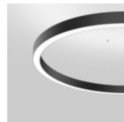
MINO 60 CIRCLE suspended