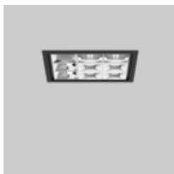
UNICO Q9 basic recessed