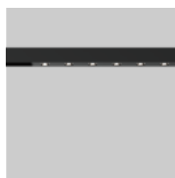
SPOT LINE MOVE IT 25