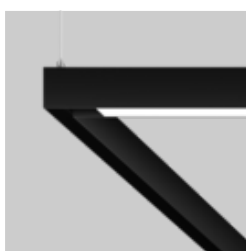
MOVE IT 25 surface / suspended system