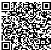
table base plate 059-2811078O 059-2891118