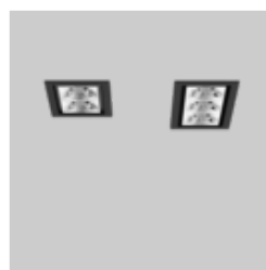
UNICO L2 / L3 basic recessed