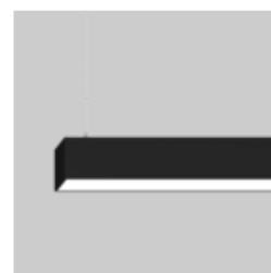
LITO 60 suspended