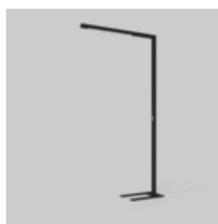
BETO free standing