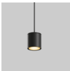
SASSO 60 round suspended