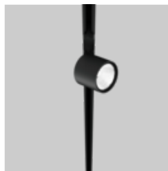
VARO 80 S