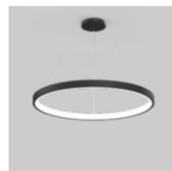
INO circle suspended