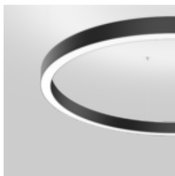
MINO 60 CIRCLE suspended