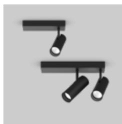
BO 45 base surface