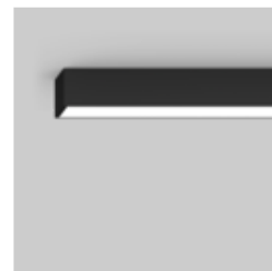
MINO 60 surface