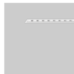
BASO 40 trim