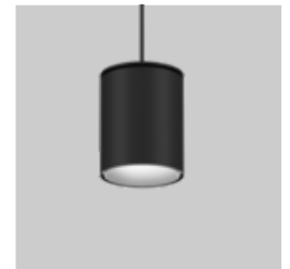
SASSO 100 round suspended