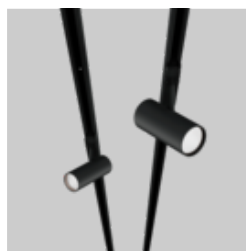
BO 55 / 70 track