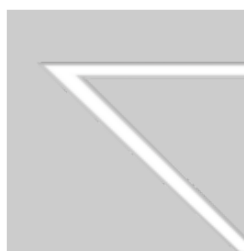
FRAME 60 trim system