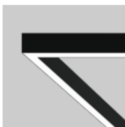
BASO 40 surface / suspended system