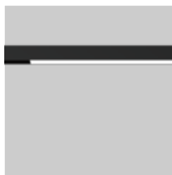
OPAL HIGH PERFORMANCE MOVE IT 25