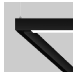
MOVE IT 25 surface / suspended system