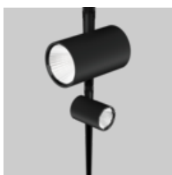
VARO 80 / 110