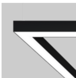
MINO 100 ceiling / suspended system