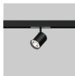
JUST 55 MOVE IT 25 / 25 S / 45