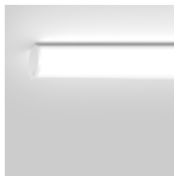
TUBO 100 surface