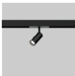
JUST 32 FOCUS MOVE IT 25