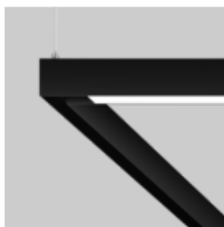
MOVE IT 25 surface / suspended system