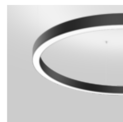
MINO 60 CIRCLE suspended