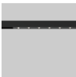
SPOT LINE MOVE IT 25