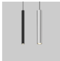
TULA MOVE IT 25 / 25 S / 45