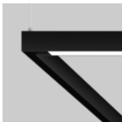
MOVE IT 25 surface / suspended system