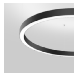
MINO 60 CIRCLE suspended