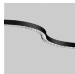
BETO ceiling / suspended system