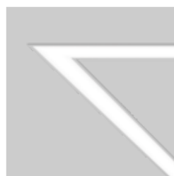
FRAME 100 trim system