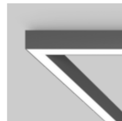
BASO 60 IP54 surface system