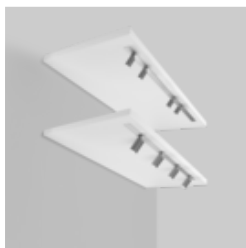
NANO just 16 / 26 / 32