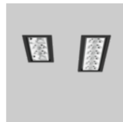
UNICO L4 / L6 basic recessed