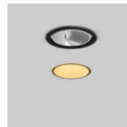
SASSO 100 round recessed 1 lamp