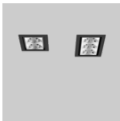
UNICO L2 / L3 basic recessed