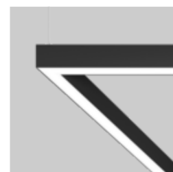
MINO 60 ceiling / suspended system