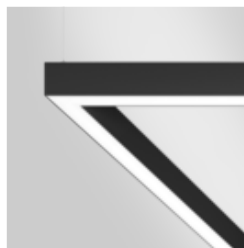
MINO 60 direct / indirect suspended system