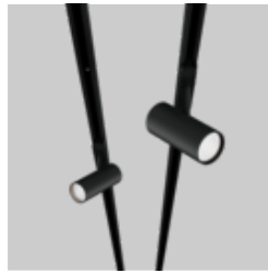
BO 55 / 70 track