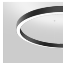
MINO 60 CIRCLE suspended