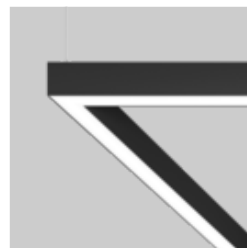
MINO 60 ceiling / suspended system