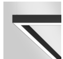
MINO 60 direct / indirect suspended system