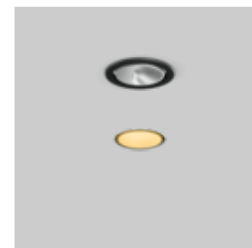
SASSO 60 round recessed 1 lamp