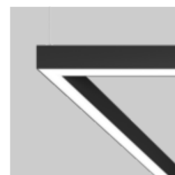
MINO 60 ceiling / suspended system