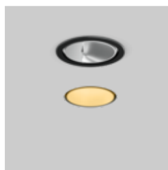
SASSO 100 round recessed 1 lamp