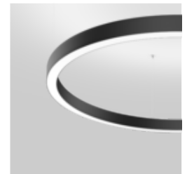
MINO 60 CIRCLE suspended